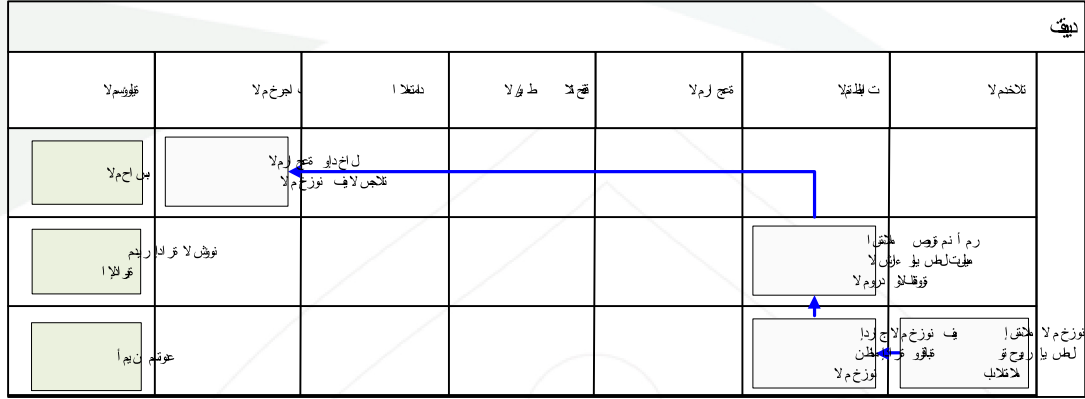
شكل رقم / ٦

يوضح المخطط البياني التالي ( شكل رقم / ٦ ) طريقة تسلسل العمل لتقبيد مشتريات المخزون: